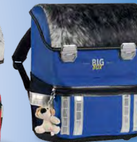
Fell blau No. 71.1813

Fell ist ein Naturprodukt. Abweichungen zu Muster und Fotos sind möglich.