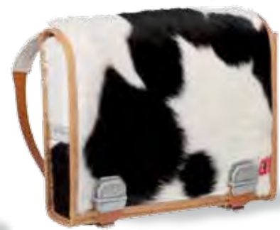
Kalbfell «Classic» schwarz 72.1260 36 x 30 x 10 cm