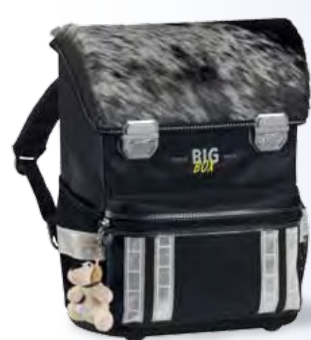
Fell schwarz No. 71.1810