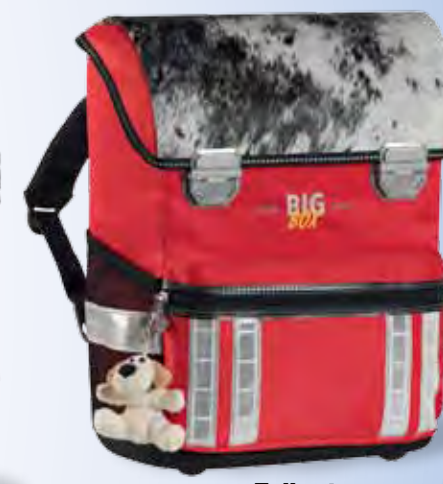
Fell rot No. 71.1812