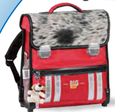
Fell rot 71.1802