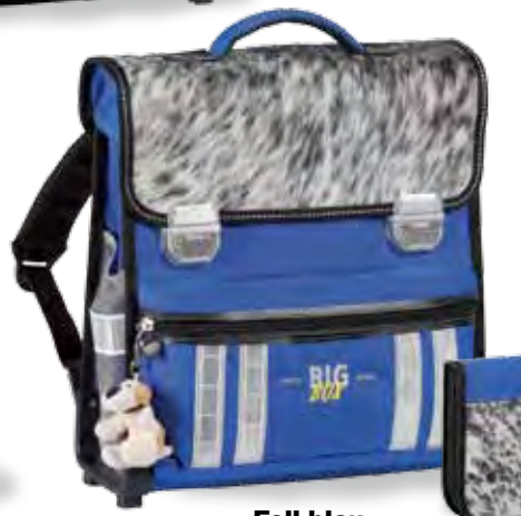
Fell blau 71.1803