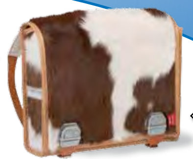
Kalbfell «Classic» braun 72.1261 36 x 30 x 10 cm

Fell ist ein Naturprodukt. Abweichungen zu Muster und Fotos sind möglich.