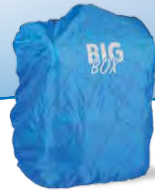
Raincoat 70.0093 passend für Bigbox Tornister und Leggero