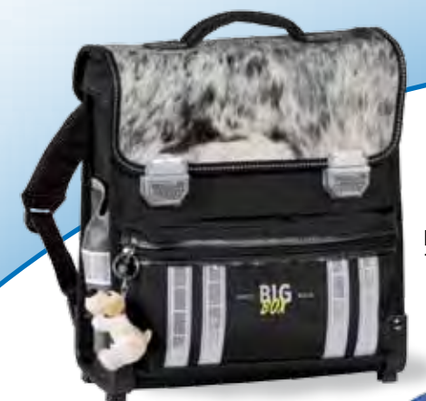
Fell schwarz 71.1800